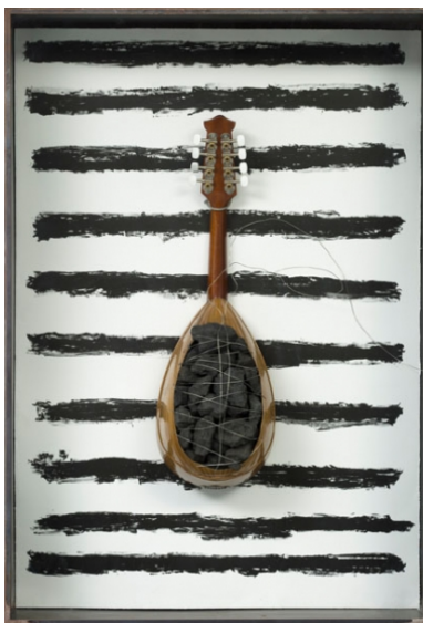
Jannis Kounellis - Mandoline, 2012 Kolen/staal/stalen kist, 25 variaties, 101,5 x 70,5 x 18,5 cm