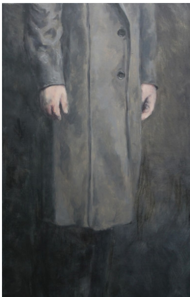
Igor Verpoorten - Man with grey coat, 2012 olieverf op doek, 130 x 85cm