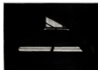
Peter Van Gheluwe Light A, 2009 inkt, charcoal, papier 77 x 107,5 cm