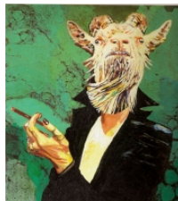
Cornelia Schleime Alte Zicke, 2009 acryl, asfaltlak, schellak op doek 200x180cm