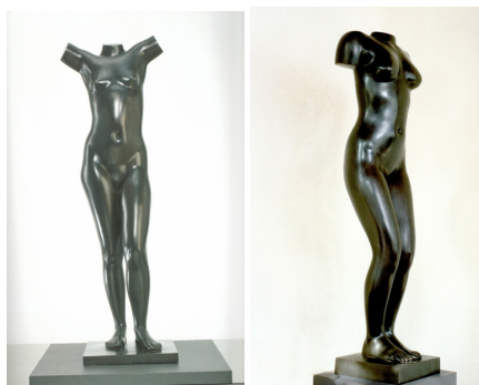
Eja Siepman van den Berg Staan meisje (links), 104 cm, 1985 Beeld Zigzag (rechts), 160cm, 1995