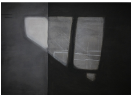
Peter van Gheluwe - G1, 2012 Inkt, houtskoolkrijt op papier, 80 x 117 cm