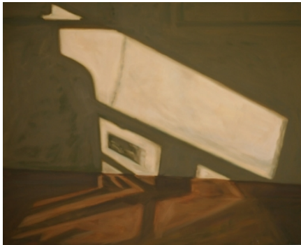
Peter van Gheluwe - S2, 2012 Olieverf op doek, 80 x 100cm