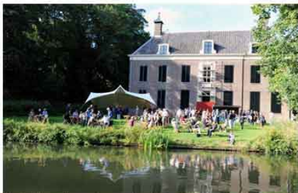
Een druk bezochte opening op vrijdag 7 september.