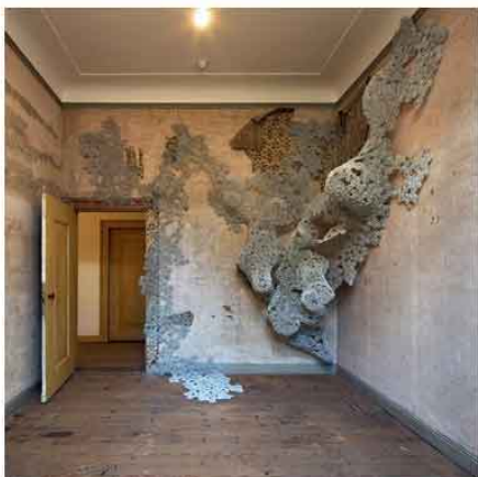
Tanja Smeets, Unbridled Wall