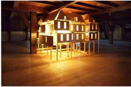
Thijs Ebbe Fokkens, Melancholic Exploded View